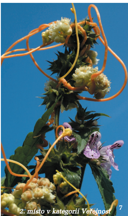
2. místo v kategorii Veřejnost 7