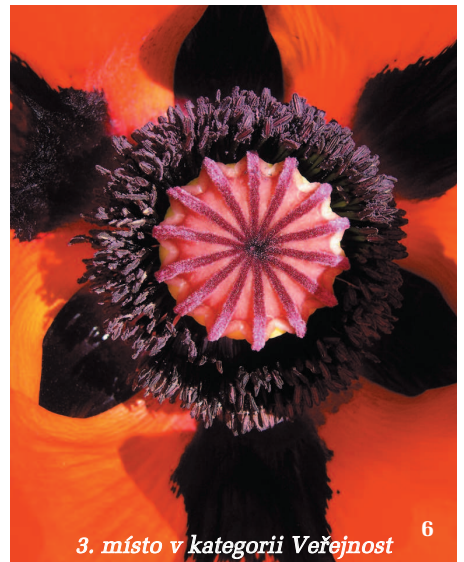
3. místo v kategorii Veřejnost 6