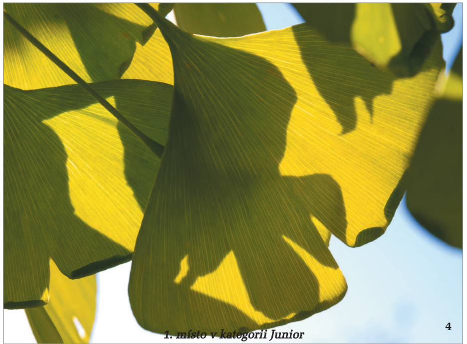
1. místo v kategorii Junior 4