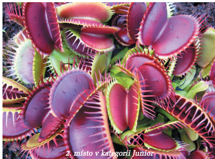
2. místo v kategorii Junioři

8 Naděje alchymistů. Kontryhel obecný ( Alchemilla vulgaris ) je velmi hojně rozšířenou léčivou bylinou, dodnes používanou např. při redukční dietě, špatném trávení či ženských obtížích. Ve středověku byl však rovněž vyhledáván alchymisty, jak už latinský rodový název napovídá, a to pro „kapky rosy“, třpytící se na okrajích listů, které sbírali a používali při hledání kamene mudrců. Ve skutečnosti se jedná o přebytečnou vodu, která je vylučována speciálními otvory hydratodami a daný jev se nazývá gutace.