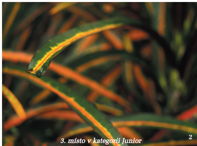
3. místo v kategorii Junioři