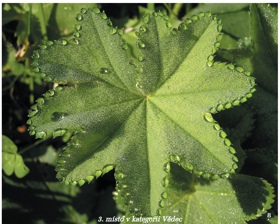
3. místo v kategorii Vědec 8