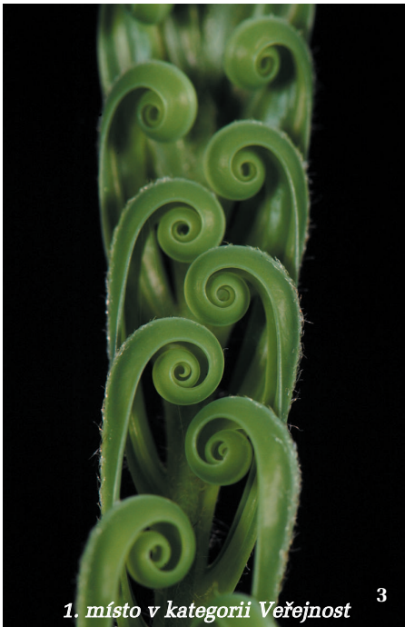
1. místo v kategorii Veřejnost 3